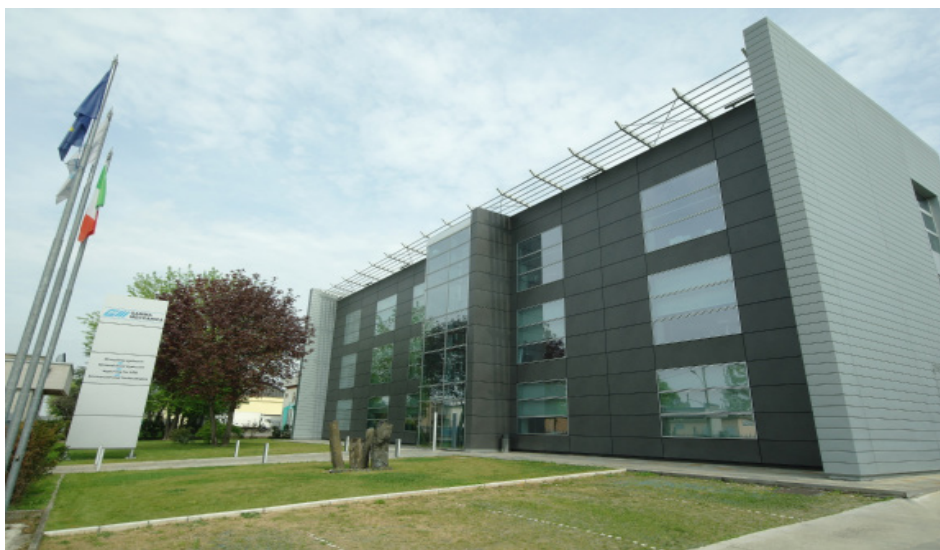
Sede Gamma Meccanica, Bibbiano (RE) - Italia